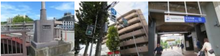
※水道橋、西横浜駅入口歩表示、天王町駅

③西横浜駅から少し歩いた先で袋小路となる。5分位引き返し、59歩ある水道橋を横切る。その先で西横浜駅入口の標識を見つける。路なりに歩いた先にラッキーにも天王町駅（10時13分）があった。高架した線路に沿って歩いた先に星川駅（10時31分）があった。東名高速道路下を潜った辺りから、高架した鉄道から道路に沿った鉄道となる。和田町駅には10時53分到着。11時7分、前方に満天の湯が見える。光栄橋を渡った先に上星川駅があった。