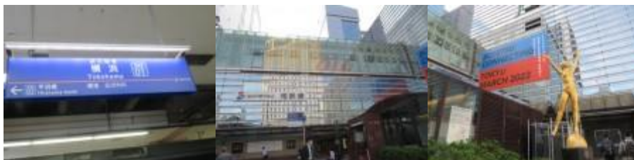
横浜駅（2023年3月予定東急東横線・目黒線連結PR）

2022年9月22日（木）晴れ/一時小雨、相模鉄道の横浜駅から大和駅までの営業キロ17.4kmにリベンジ。この区間は、2000年7月16日（日）に踏破済であるが、“日本横断歩き鉄の旅”PDF読本の第48編（相模鉄道・東葉高速鉄道・都電荒川線）の執筆に当り、駅舎画像や立ち寄り時刻などに不備があることが判明のため本日の再挑戦となった。一度挑戦したため、地図なし事前勉強なしで臨んだ。22年前に歩いて、鶴ヶ峰駅と瀬谷駅で手こずった記憶が脳裏の片隅に残っていた。残念ながら、本日も前回と同じパターンの繰り返しとなった。また、天王町駅から星川駅にかけて、レールが高架されていたので歩きやすかった。