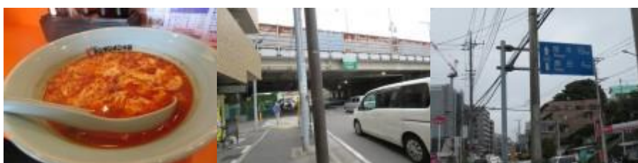
※卵入り坦々麺、二俣川駅へも路

⑥13時21分、保土ヶ谷バイパス下を潜る。県道40号線（厚木街道）を歩く。13時25分、厚木19km、瀬谷4kmと記した道路標識前を通過。この辺りでポツリと水滴を感じる。ここから傘をさしたり、たたんだりしながら大和駅を目指す。二俣川駅には13時32分到着。駅ビルであるジョイナスに立ち寄り、小休止する。