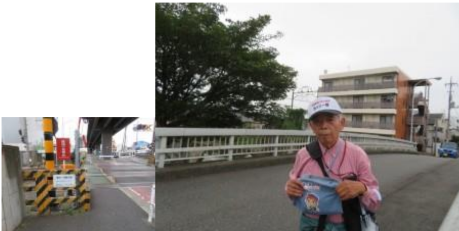
※瀬谷1号踏切道、境川（22年前はこの橋渡りに戸惑う）

⑧15時41分、瀬谷1号踏切道を横切り、相鉄線の左側に沿って歩く。15時50分、町田界限から流れている境川（鹿島橋）を横切る。この川を渡る際、カッシー館に登場する境川の画像を思い出し懐かしくなった。路なりに歩いた先に大和駅（16時14分）があった。16時20分の小田急線で自宅へ。本日も天と神のご加護に加え、地元の人のお世話を頂き、感謝・感激一杯の一日となった。