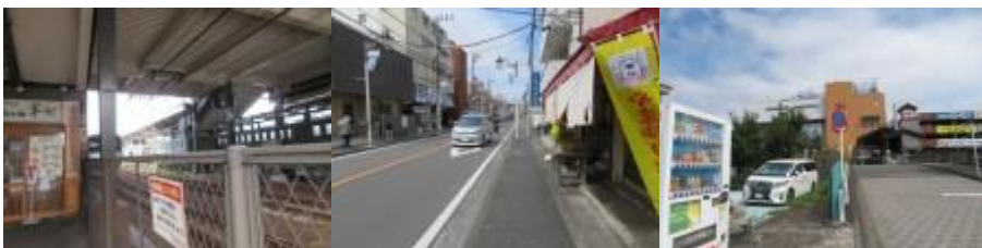
※和田町駅、上星川駅への路、満天の湯