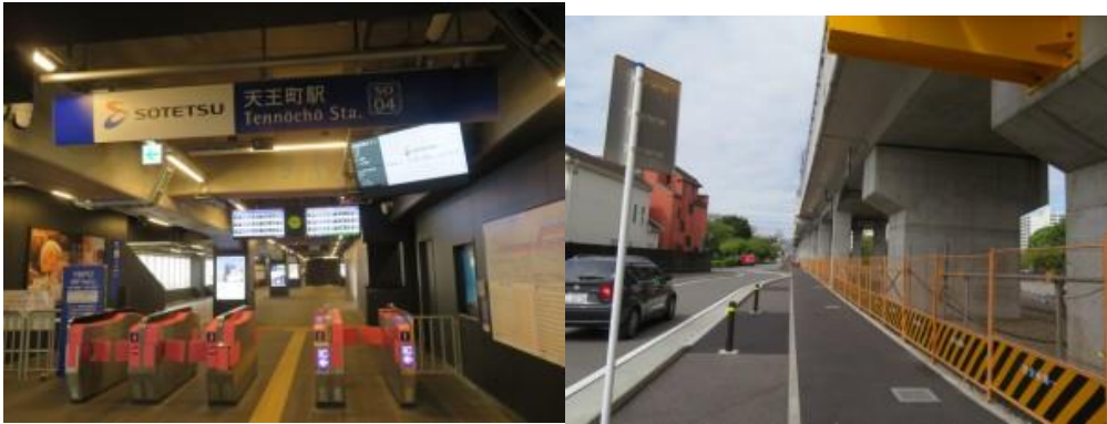
※天王町駅、星川駅への路