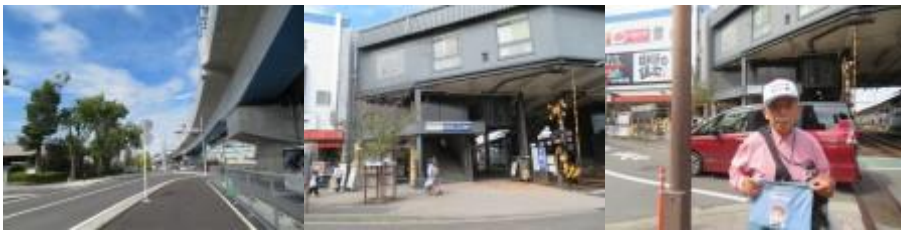
※和田町碧への路、和田町駅