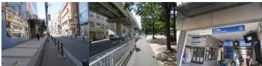
※平沼橋駅への路、平沼橋駅

①9時、幸橋(幸川)を渡り、幸川に沿って歩く。平沼橋駅前に到着するが、500m位ビル周辺を一周する。平沼橋駅は、一周したところから20m位急な階段を上った先にあった。9時22分、平沼橋駅にやっと到着する。陸橋を經由し、並走しているJR線・相鉄線の左側を歩く。9時25分、水天宮平沼神社で本日の安全を祈願する。この神社を見るや否や、30年前、注文住宅建築のため、家内と一緒に何度も足を運んだ横浜展示場の日々を思い出した。