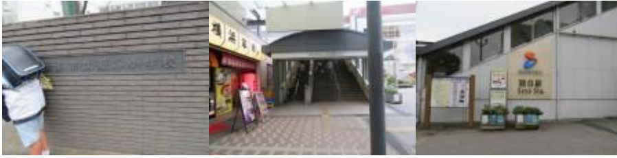
※瀬谷小学校、瀬谷駅

⑧15時41分、瀬谷1号踏切道を横切り、相鉄線の左側に沿って歩く。15時50分、町田界限から流れている境川（鹿島橋）を横切る。この川を渡る際、カッシー館に登場する境川の画像を思い出し懐かしくなった。路なりに歩いた先に大和駅（16時14分）があった。16時20分の小田急線で自宅へ。本日も天と神のご加護に加え、地元の人のお世話を頂き、感謝・感激一杯の一日となった。