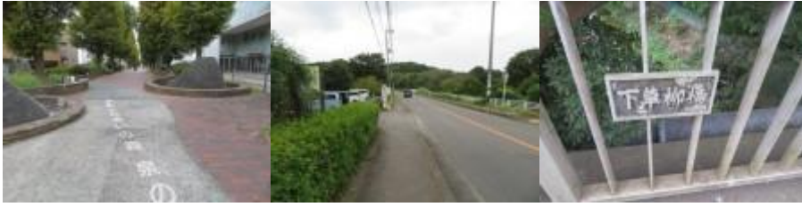
※相模大塚駅への路