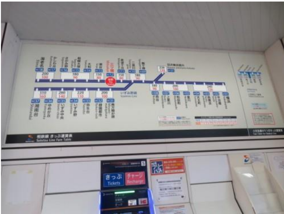
※相模鉄道路線図（三ツ境駅）