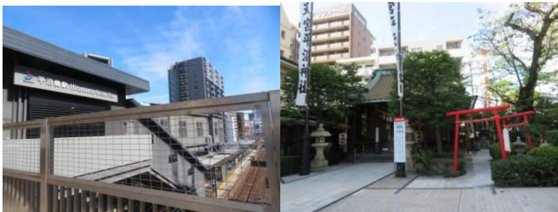
※平沼橋駅、水天宮平沼神社

②9時36分、国道16号線に合流する。相模原27km、鶴ヶ峰7kmと記した道路標識があった。JR線と相鉄線を跨ぎ(9時41分)、鉄道の右側となる。この界限からJR線と相鉄線が大きく分岐する。地元の人のお世話になり、くねくねとした道筋を經由し、9時57分、西横浜駅に到着する。この駅も急な陸橋階段を上った先にあった。