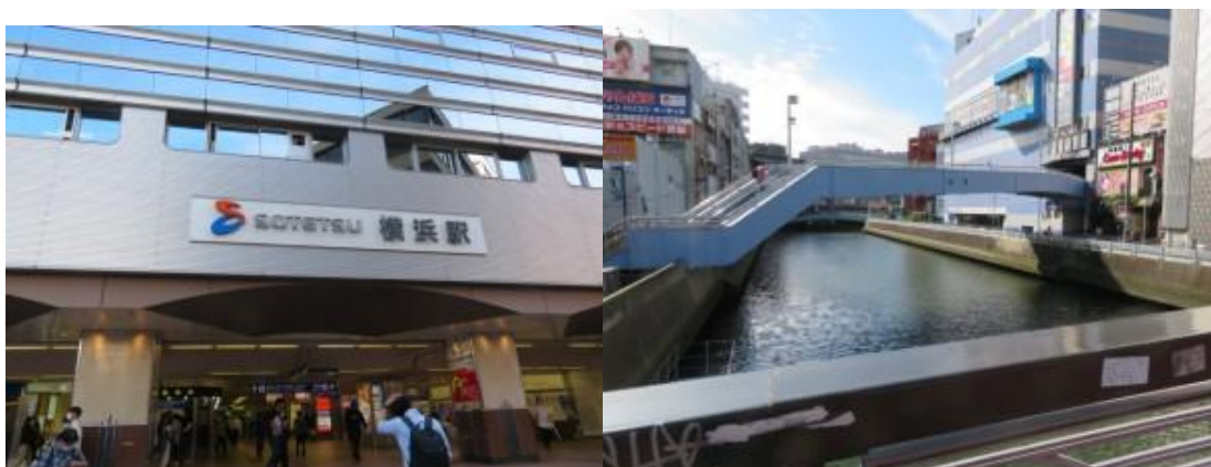
横浜駅、幸橋（さいわい川）