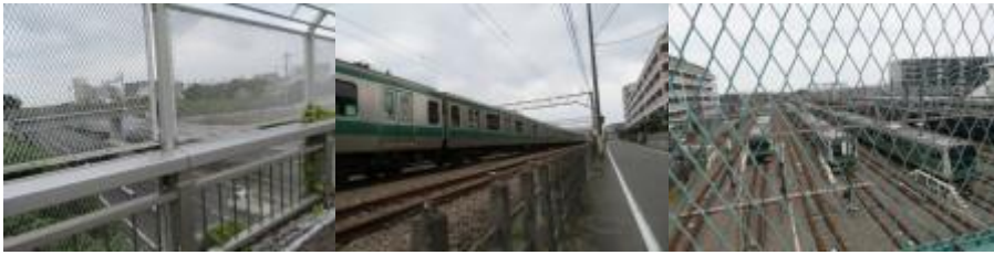
※東名を横切る、相模大塚駅