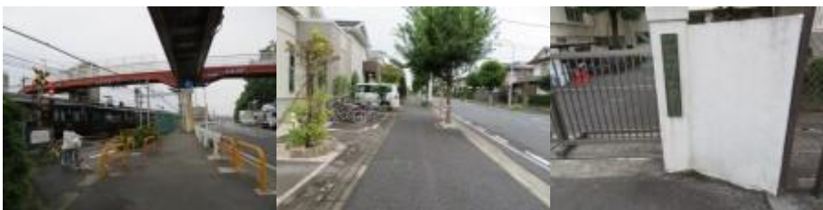
※瀬谷駅への路、相沢総学校