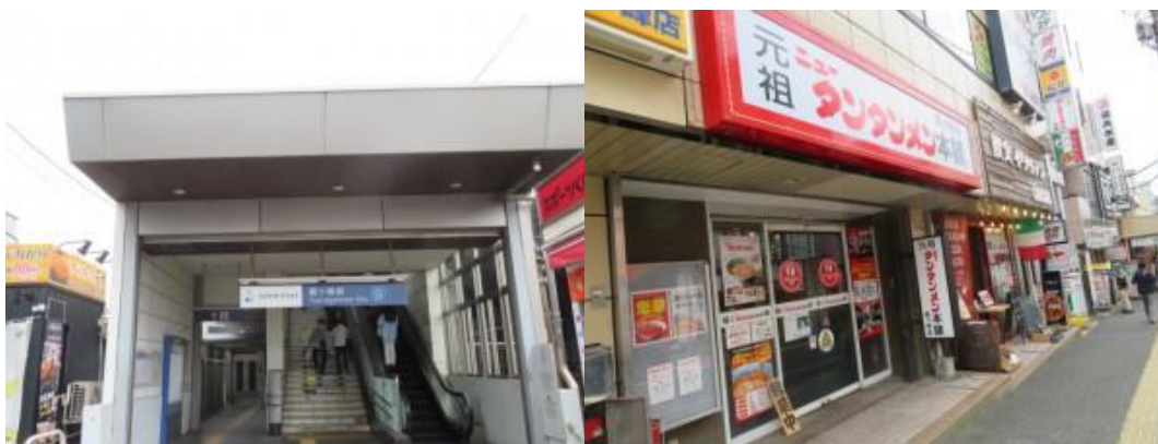
※鶴ヶ峰駅、元祖タンタンメン本店に立ち寄る